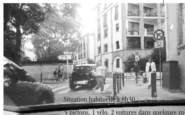
Situation habituelle à 8h30 :

NDLR : voir aussi en page 5 l'article sur la circulation de transit