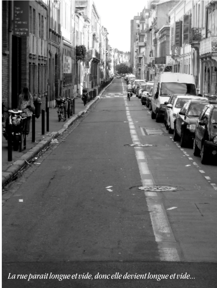
La rue paraît longue et vide, donc elle devient longue et vide...

Les commerçants du marché y sont sympathiques, ils apprécient mes biscuits franco-américains épisodiques et m'accueillent toujours d'un mot gentil. Le coiffeur s'est mis en quatre pour donner un coup de main à une copine, pour un entretien d'embauche, parce que ses cheveux étaient un désastre après l'intervention d'un autre coiffeur. Les résidents du numéro 10, rue Roquelaine (pas Downing street) décoorent leur maison, déjà très jolie, de fleurs et de guirlandes lumineuses pour Noël. C'est une rue agréable et chaleureuse, mais dans l'ensemble peu passionnante. Quand on regarde la rue, celle-ci descend toute droite vers la Place Roquelaine. Plusieurs personnes ont des problèmes avec la place Roquelaine et ce qui s'y passe, ou ce qui ne s'y passe pas. J'ai lu récemment que c'était ce que l'on appelle un "skid row park", c'est-à-dire un endroit où les SDF (ou assimilés) et leurs chiens se rassemblent la majeure partie de la journée. Il faut dire qu'ils sont les seuls dans le quartier à avoir le temps de s'asseoir là pendant la journée. Les enfants passent rapidement pour aller à l'école de l'autre côté de la rue, ou en revenir. La fermeture de plusieurs commerces de quartiers alentour prouve le peu de passage sur la Place. Ce lieu ne peut en effet générer d'activité, seul un quartier animé peut le faire. La place