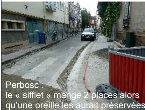
Perbosc : le « sifflet » mange 2 places alors qu'une oreille les aurait préservées

Las ! Nous n'avions pas imaginé que nos trottoirs seraient défoncés sur de grandes portions de ces rues et modifiés avec comme conséquence la suppression d'un certain nombre de places de stationnement. Élargir le passage de la rue Perbosc à la rue de la Balance, était-ce nécessaire? Si oui, pourquoi partir en oblique en condamnant deux places de stationnement rue Perbosc? Et pourquoi à l'angle Perbosc-Balance un passage