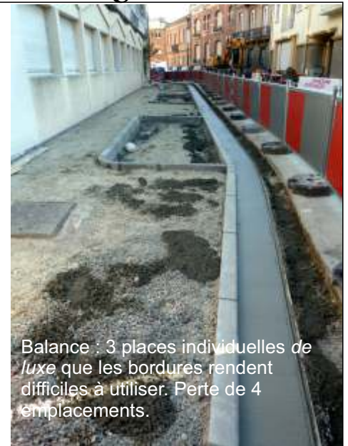
Balance : 3 places individuelles de luxe que les bordures rendent difficiles à utiliser. Perte de 4 emplacements.

piétons de quatre mètres de large au lieu de trois mètres ? Trois mètres auraient permis à quatre voitures de se garer rue de la Balance ! Et ces places délimitées de la rue de la Balance sont-elles toutes destinées à des deux roues qui ne sont tout de même pas si nombreux dans ce secteur ? Il semble qu'il y ait une volonté de chasser les voitures de nos rues et, sans être des inconditionnels de l'automobile, les riverains ont dans certaines circonstances besoin d'utiliser leur véhicule (travail, accompagnement d'enfants ou de personnes âgées, courses, sorties hors de Toulouse...)