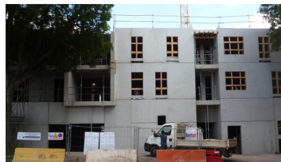
Construction en cours avenue Honoré Serres

de construire les équipements publics dont le quartier a besoin ?