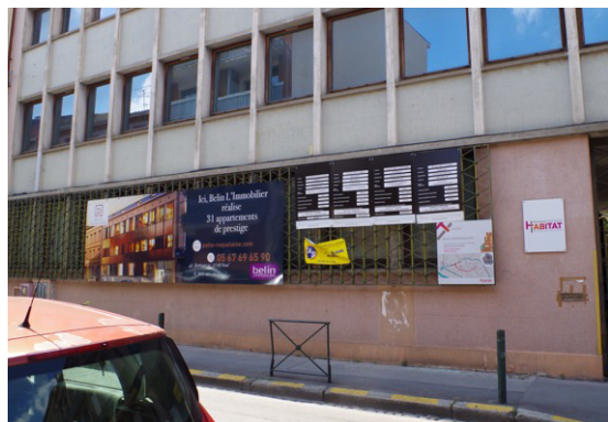
L'immeuble qui va être aménagé par Belin

Nous regrettons vivement que la Ville n'ait pas saisi l'opportunité de cette mutation. Il ne reste plus que la parcelle du 37 rue Roquelaine. La ville saura-t-elle préserver l'avenir de notre quartier en se donnant les moyens