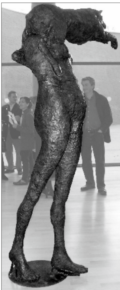
La double figure (1975)

Elle poursuit son travail chez elle à Toulouse