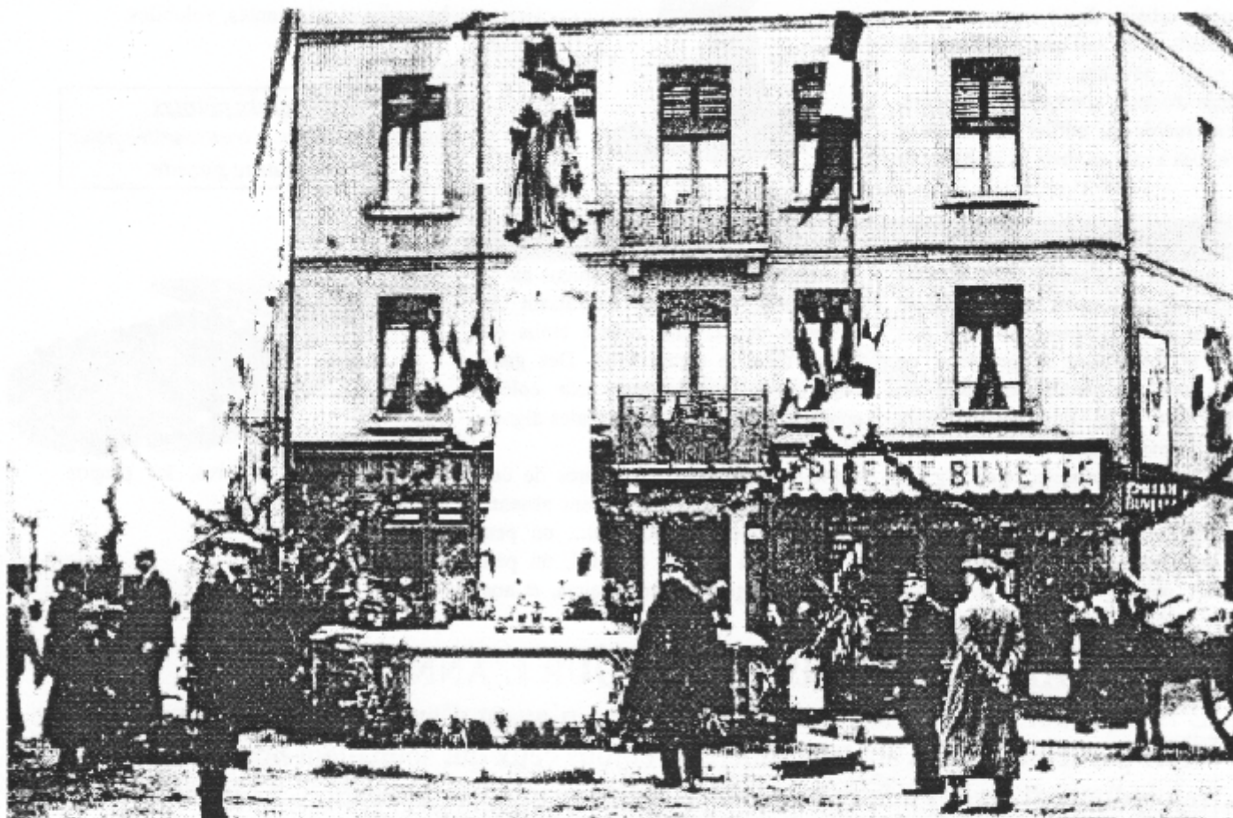
13 avril 1910 : l'inauguration de la statue