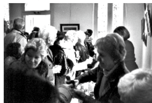
Ab ! C'est bien ici ...