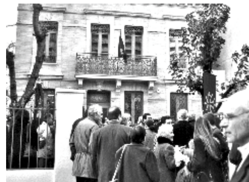
Foule et décoration des grands jours