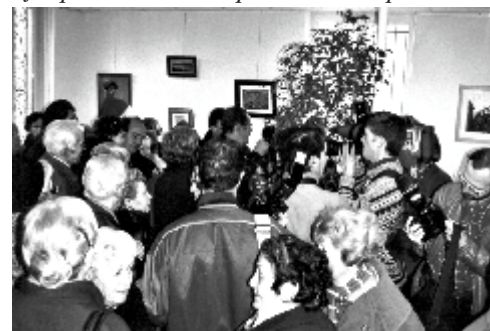
Il doit bien y avoir des choses intéressantes, là-bas