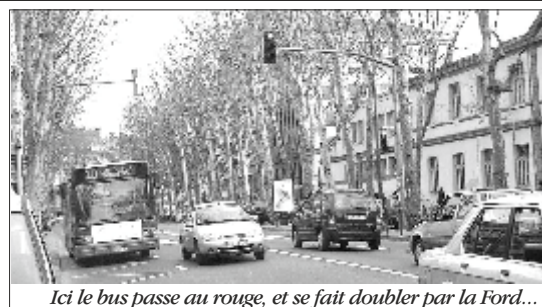
Ici le bus passe au rouge, et se fait doubler par la Ford...

Les enfants des Chalets fréquentant l'école du Nord sont quotidiennement confrontés aux dangers de la circulation automobile. Nous avons alerté à de multiples reprises la municipalité à ce sujet, comme le faisaient de leur côté les parents d'élèves et le conseil d'école. Notre commission circulation a organisé une opération de comptage du 25 février au 1er mars, à toutes les heures de fréquentation scolaire. Le constat est accablant : le feu protégeant le passage piétons sur le boulevard devant l'école est très fréquemment grillé (plus de 100 fois au rouge sur une semaine, uniquement aux heures d'entrées-sorties de l'école, alors que des enfants traversent ou attendent), des voitures stationnent en permanence sur les trottoirs du boulevard d'Arcole et sur le passage piétons. Nous avons demandé au Maire la réalisation de travaux permettant de sécuriser le trajet des enfants. Depuis le début de l'année, deux enfants de l'école ont été victimes d'accrochages. Le 25 avril, les