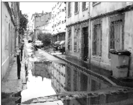
Un jour de pluie, avant les travaux...

Depuis plusieurs années, nous avons attiré l'attention de la municipalité sur la situation de la rue Saint-Germier, transformée en piscine après chaque averse. De gros travaux de réfection de l'éégout pluvial viennent d'être réalisés, nous espérons qu'ils apporteront une solution définitive aux difficultés des riverains et usagers de la rue.