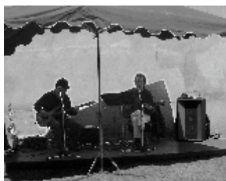
Abrité sous le parasol, le duo Bandagavroche. Mais au soleil, ça swingue !