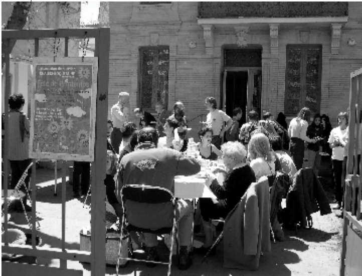
Au menu : le soleil (enfin ! ) mais aussi des côtes d'agneau, des merguez, des costéous ... Et les petits plats que chacun avait concoctés pour partager.