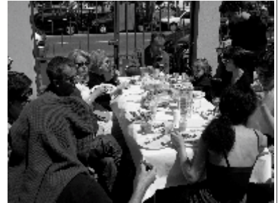
Au choix : une douzaine de gros gâteaux pour beaucoup plus de gourmands