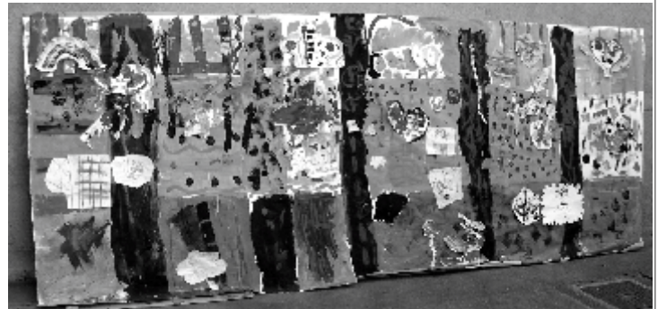
Archipel sait comment faire pour que les petits réalisent le chef d'oeuvre du jour (affiché à la Maison de Quartier)