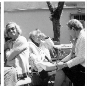
Ici, on en profite pour causer : loge des îlotiers, cuisine, stationnement, travaux du collège, théâtre ... Mais les ados préfèrent la vidéo