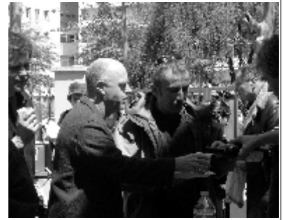
Mais si, il y en a eu pour tout le monde !