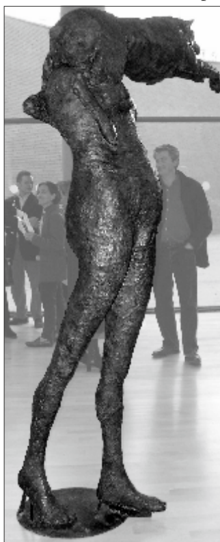
La double figure (1975)