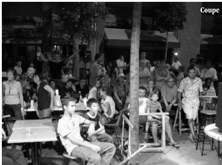
Coupe du monde