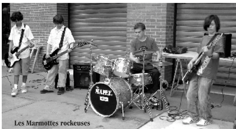
Les Marmottes rockeuses

Sans oublier, bien sûr, l'équipe spéciale apéro qui partage la lourde responsabilité de la mise en ambiance.