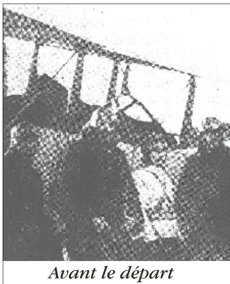
Avant le départ