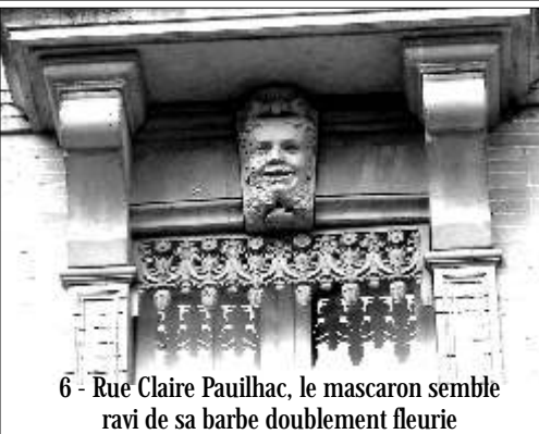
6 - Rue Claire Pauilhac, le mascaron semble ravi de sa barbe doublement fleurie