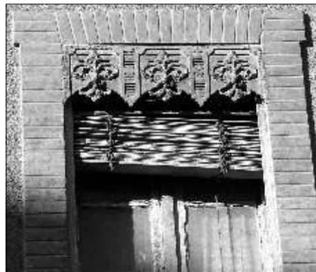
4 - Rue du Printemps, dans son jus . les lames ne sont pas totalement remontées