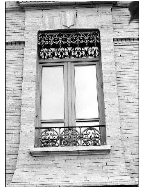
5 - Boulevard Matabiau (maison de quartier) des motifs coordonnés pour balcon et lambrequin avec un encadrement de fenêtre très soigné

Une trentaine de fondeurs exerçaient à Toulouse fin 19 ème et fournissaient les entrepreneurs avec une grande diversité : on a répertorié plus de 30 modèles dans notre quartier équipant des fenêtres de plus de 200 immeubles. Nous n'avons pas retrouvé de traces de fabrication locale dans les archives. Un fabricant lyonnais propose encore un modèle de balcon et lambrequin réalisés à partir d'un même moule (Fonderie Vincent). On en trouve sur quelques fenêtres place Jeanne d'Arc.