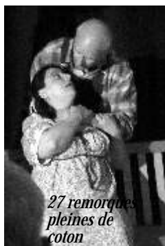
27 remorques pleines de coton