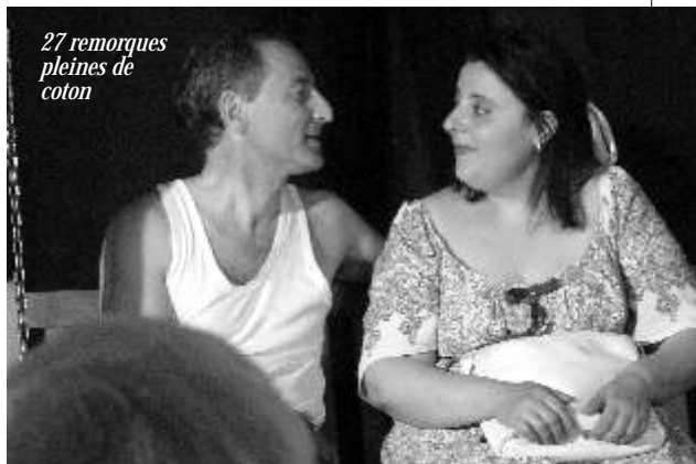
27 remorques pleines de coton