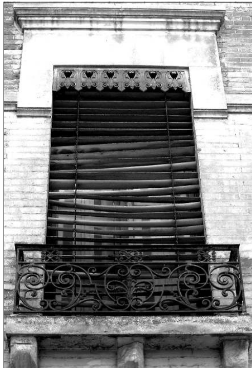
3 - Rue de la Balance (la jalousie a maintenant disparu)

On a retrouvé dans les annuaires plusieurs fabricants toulousains, dont un presque dans le quartier (2).