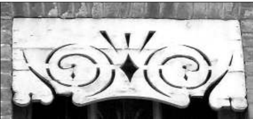
8 - Rue Saint-Hilaire, un dessin enlevé sur un panneau de bois