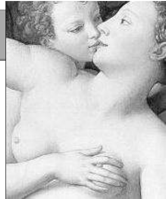
15 - Bronzino Les triomphes de Vénus (détail)