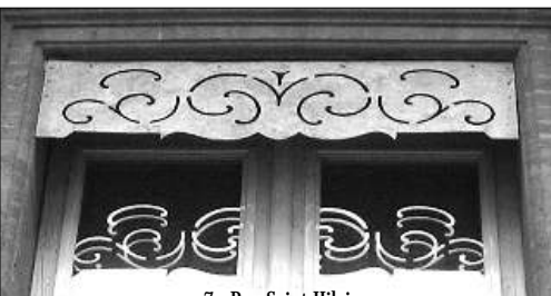
7 - Rue Saint-Hilaire Un modèle simple en tôle s'anime avec son reflet sur les vitres