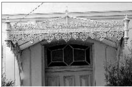
12 - Rue Saint-Hilaire, la marquise s'est équipée de deux lambrequins presque symétriques