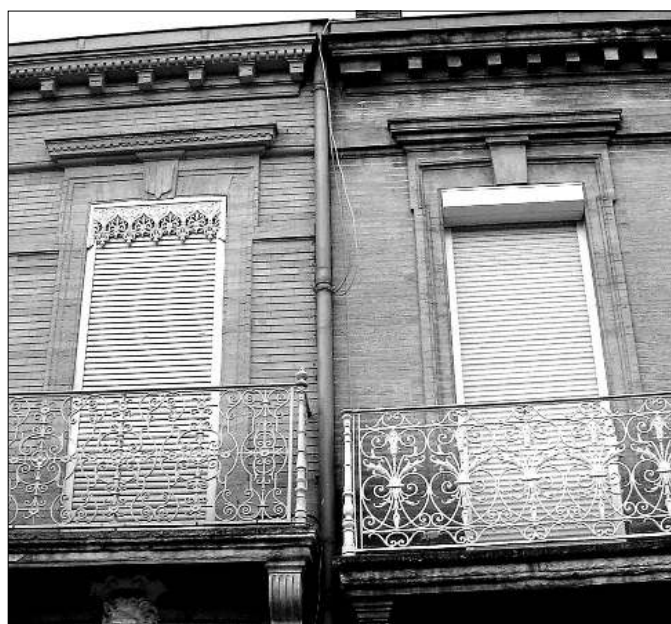
14 - Rue Franc : la maison de gauche a conservé ses lambrequins et son élégance malgré la couleur crue des volets.