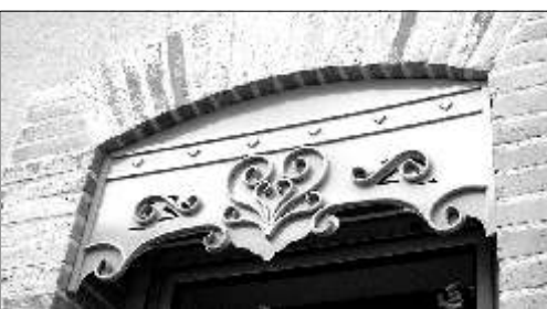
10 - Rue de la Concorde Modèle récent en tôle et fer forgé