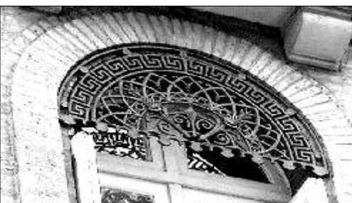
11 - Bd d'Arcole, pas de place pour la jalousie, mais quelle élégance !