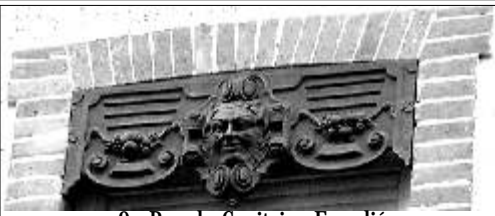
9 - Rue du Capitaine Escudé Un modèle en fonte concurrençant les mascarons