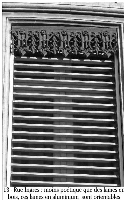
13 - Rue Ingres : moins poétique que des lames en bois, ces lames en aluminium sont orientables