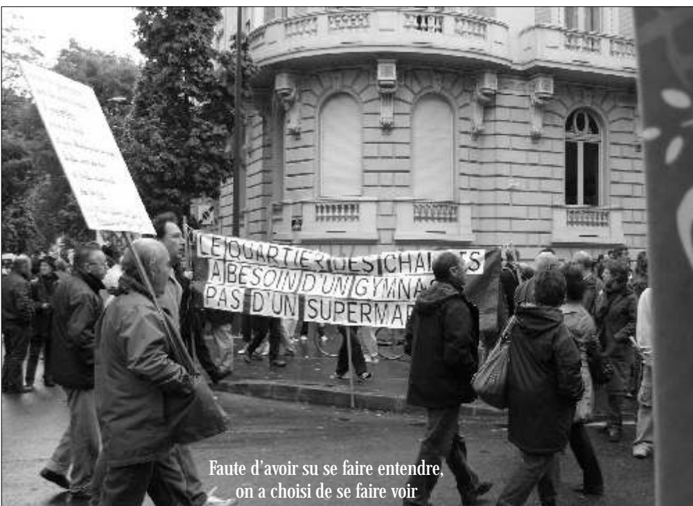
Faute d'avoir su se faire entendre, on a choisi de se faire voir

LIDL de la rue Bayard, pour lequel l'aire de livraison est prévue le long du trottoir rue de Stalingrad, la circulation est coupée tous les matins ouvrables, parfois pour plusieurs heures.