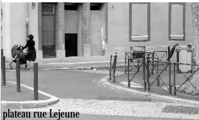
plateau rue Lejeune

Le test de ces doubles sens doit nous inciter à rechercher avec application des solutions aux problèmes que nous rencontrerons. Nous souhaitons que les lecteurs de La Gazette participent le plus possible à ce test en nous signalant les difficultés rencontrées, en proposant des solutions, nous les transmettrons à l'équipe technique du service circulation qui a promis de nous associer à la démarche. Comme d'habitude, l'Association aura à cœur de soutenir les besoins exprimés par les habitants du quartier.