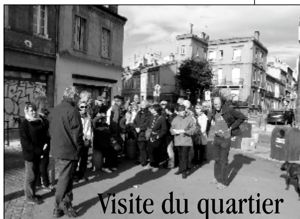
Visite du quartier