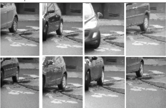
Les vélos existent difficilement devant les voitures en transit (ici 3 minutes au carrefour Mérimée-Balance)