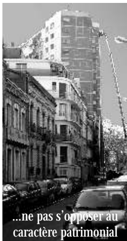
...ne pas s'opposer au caractère patrimonial

Accueillir 15 000 habitants nouveaux par an dans l'agglomération suppose de construire, de réhabiliter, de densifier la ville. La densification des quartiers anciens, bien que limitée par les disponibilités foncières, ne doit pas s'opposer au maintien du caractère et du patrimoine des quartiers. Les formes urbaines du quartier des