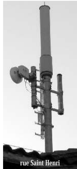
rue Saint Henri