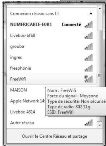
À gauche : pour 1 connexion effective au réseau, 11 sont détectées, dont 1 hotspot ( freewifi , rue Ingres en mai). Ci-dessous : carte wifi du quartier pour un seul des 3 principaux opérateurs en place (qui seront bientôt 4).

Les effets induits sur la santé sont semblables, les plus nocifs semblant dus à la multipulsion. Voir : http://www.robindestoits.org/Preuves-scientifiques-du-danger-pour-la-sante-de-la-telephonie-mobile-le-rapport-Bioinitiative-2007-a78.html .